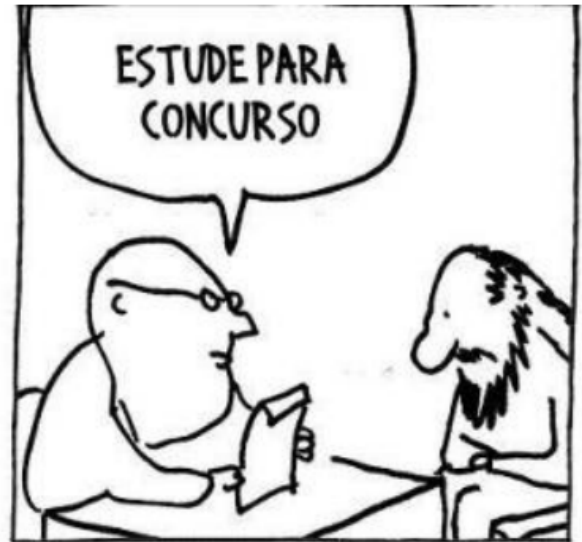
DAHMER, André. Não Há nada acontecendo. Folha de São Paulo, abril de 2025.